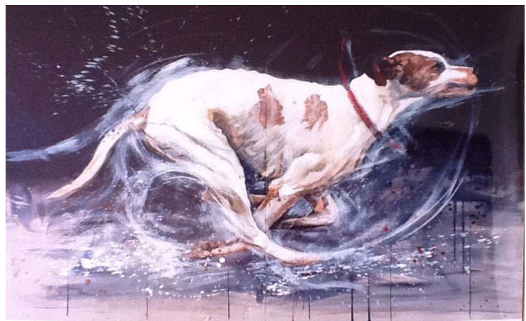
Γιώτα Ιωαννίδου , «Σκύλος Δρομέας» Ακρυλικό σε χαρτί, 2000